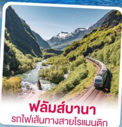
พหลิมส์บานา รถไฟเส้นทางสายโรเมนติก