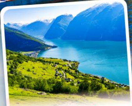
ช่องฟยอร์ด