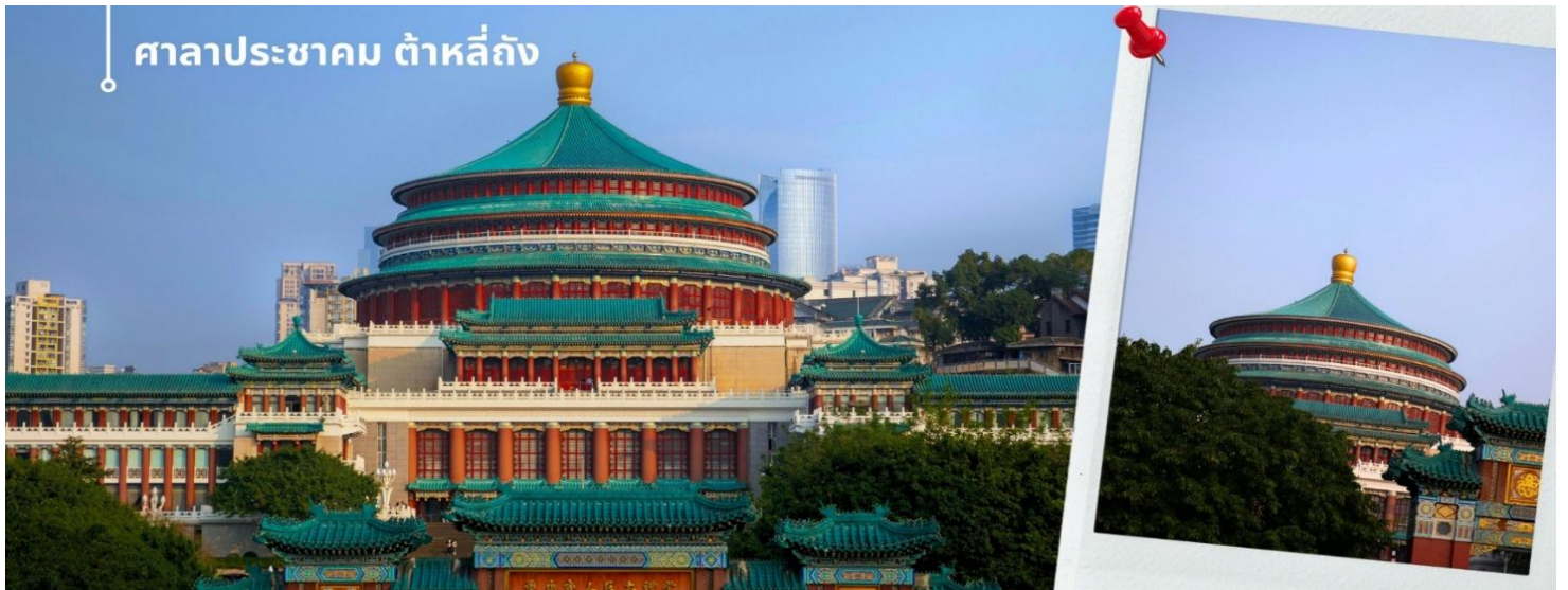
ศาลาประชาชน ต้าหลี่ถิง

นำท่านเดินทางสู่ ศาลาประชาชน เป็นสถานที่หนึ่งในสัญลักษณ์ของเมืองฉงชิ่ง ด้วยสีส้มและรูปแบบการจัดวางอย่างโดดเด่นและลงตัว มีการผสมผสานของศิลปะในยุคราชวงศ์หมิงและราชวงศ์ชิงเข้าไว้ด้วยกัน ด้านหน้าจะเป็นลานกว้าง ในตอนเย็นและตอนกลางคืนจะมีผู้คนจำนวนมากเข้ามาชมร่วมกันทำกิจกรรม เดินชมแสงไฟยามค่ำชื่นชมจิตรกรรมต่างๆ