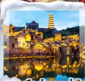
เมืองโบราณกุ๋เป่ย์