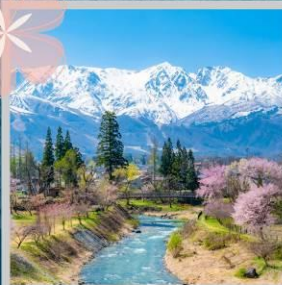
"HAKUBA OIDE PARK"