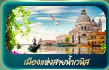
เมืองแห่งสายน้ำเวนิส

จุดรวบรวมความอลังการของธรรมชาติ Dolomites และ ทะเลสาบมิซูริน่า ชมน้ำสีเทอร์ควอยซ์ ทะเลสาบเบรียส สตรีโรเมนติกาเมืองแห่งสายน้ำอวิส ห้างปลอด มหาวิทยาลัยโอโมแห่งมิลาน โรบิน อาธิ่น่า บ้านของจูเลียต เกี่ยวลูเชริน ชมสิงโตหินแกะสลัก เดินเล่นสะพานไม้ชาเปล อินส์บรุค ย้อนอดีตกับสาชนต์แอนน์ หลังคาทองคำ ช้อปปิ้ง Outlet