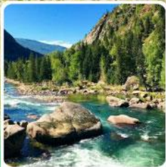
อุทยานเคอเคอทั้วไห่