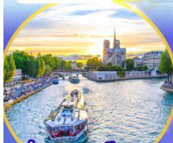
ล่องเรือแม่น้ำแอมสเตอร์ดัม