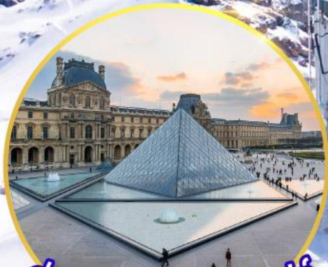
ถ่ายรูปที่พิพิธภัณฑ์ลูฟร์