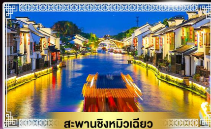
สะพานชิงหวีเวี๊ยว