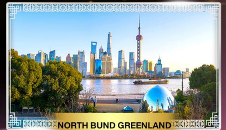
NORTH BUND GREENLAND