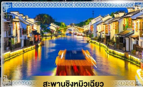
สะพานชิงหมิงเจียว