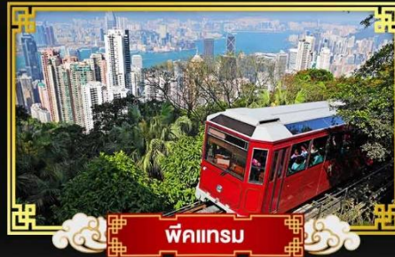
พีคแตรัม