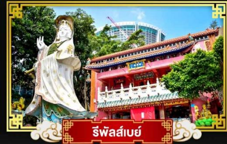
รีพัลส์เบย์