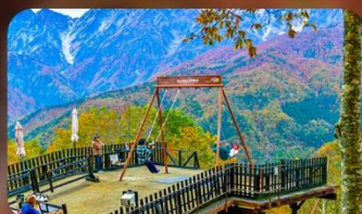
ฮาคุบะอิวาทากะ