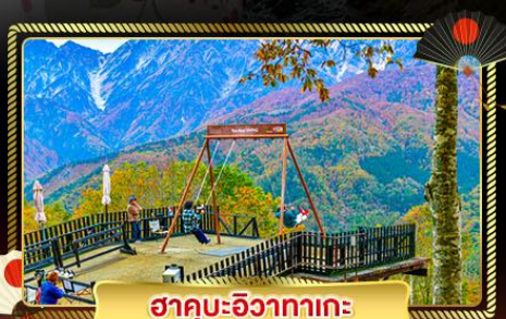
ฮาคุบะฮิวงาทาเกะ