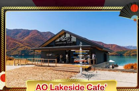
AO Lakeside Cafe'