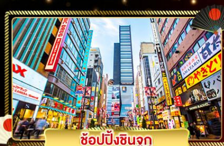
ซ้อปิ้งชินจูกุ