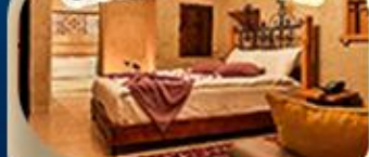
คัปปาโดเกีย

ไฮไลท์ สัมผัสประสบการณ์ ดินแดนสองทวีป มรดกโลกอันทรงคุณค่า ม้าไม้เมืองทรอย สุเหร่าสีน้ำเงิน ปราสาทปุยฝ้าย ทะเลสาบเกลือ หอคอยกาลาตา เที่ยวชม เมืองโบราณเฮียราโพลิส นครใต้ดินชาดัค พระราชวังทอปกาปี ฮาเกียโซเฟีย สุสานอตาเดิร์ก