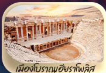
เมืองโบราณเฮียราโพลิส