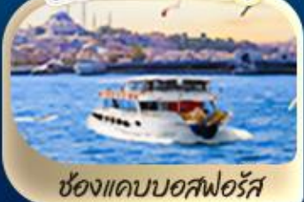
ช่องแคบบอสฟอรัส