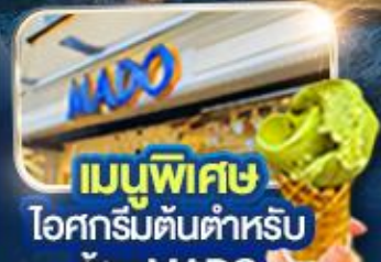
เมนูพิเศษ ไอศกรีมต้นตำหรับ ร้าน MADO