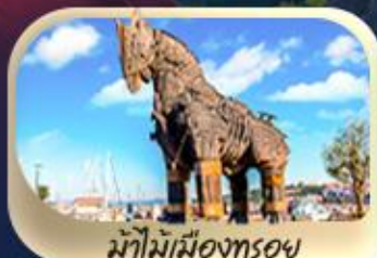
ม้าไม้เมืองทรอย