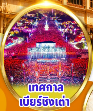
เทศกาล เบียร์ชิงเต่า