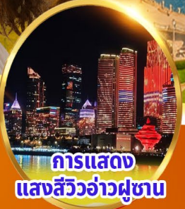
การแสดง แสงสีว้าวคู่ขนาน