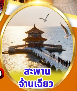
สะพาน จ้านเจียว