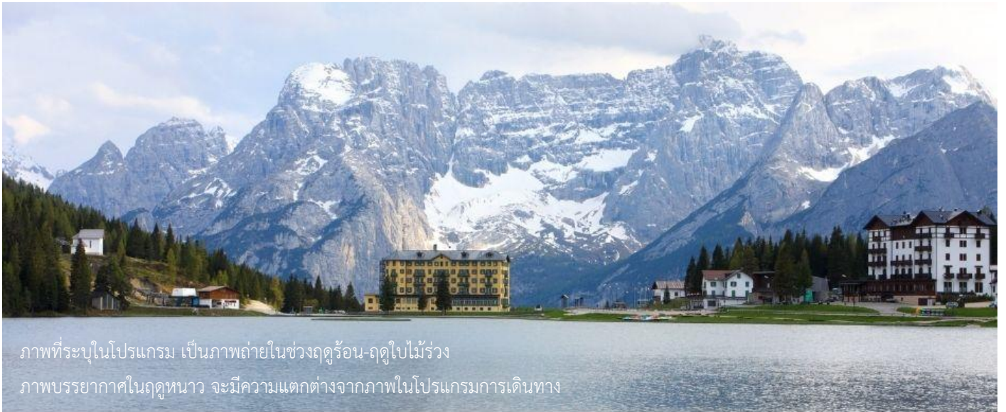
ภาพที่ระบุในโปรแกรม เป็นภาพถ่ายในช่วงฤดูร้อน-ฤดูใบไม้ร่วง ภาพบรรยากาศในฤดูหนาว จะมีความแตกต่างจากภาพในโปรแกรมการเดินทาง