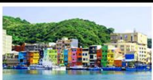
ทำเรือประมงเจิ้งปิ่น

รถไฟสายโบราณอาลีซาน - ตึกไทเป 101 ประมงเจิ้งปิ่น - จิวเฟิ่น - ล่องเรือทะเลสาบสุริยันจันทรา ถนนเมบูเค็ด เสี่ยวหลงเป่า & ปลาประ-รานาธิบดิ์ ช้อปปัง 3 ย่านคิง : ซีมินคิง - ไทจงไนกั่มาร์เก็ต - MITSUI OUTLET