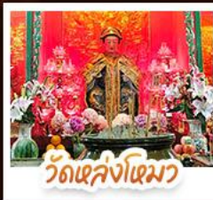
วัดเล่งจิงเมิว

นั่งรถรางพิกแตรมสู่ TOP OF PEAK • ซ้อปั้งจูงมงก๊ก และ CITYGATE OUTLAETS • นั่งกระเช้าองปิง สักการะพระใหญ่เทียนถาน • จอพรเจ้าแม่หล่งโหมว แม่ของ 5 มังกร ให้ประสบความสำเร็จในทุกๆ ด้าน