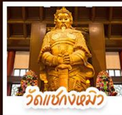
วัดเชกวงเมิว