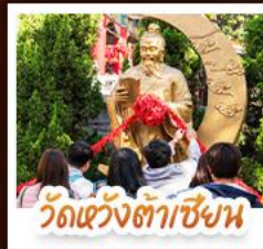
วัดเซว้งต๋าเซียง