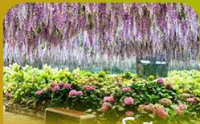
สวนนกเป็ดนึ่ง