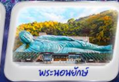
พระนอนยักษ์