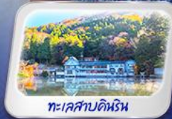
ทะเลสาบคินริน