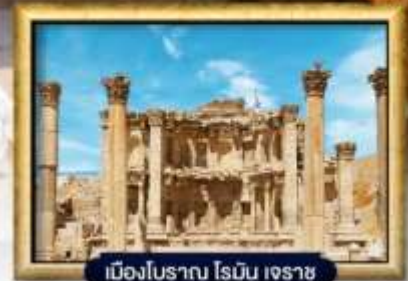
เมืองโบราณ โรมัน เจราช