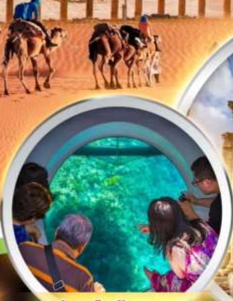
ล่องเรือท่องกระจก