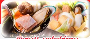
พิเศษ!! บุฟเฟ่ต์ซาซุ

โปรแกรมการเดินทาง 5 วัน 3 คืน : เดินทางโดยสายการบินไทยเวียดเจ็ทแอร์