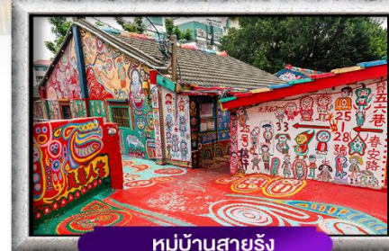
หมู่บ้านสายรุ้ง