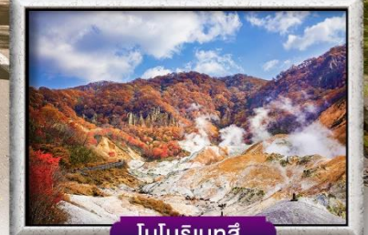
โทบุริเทสึ