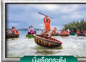
นั่งเรือกระดัง