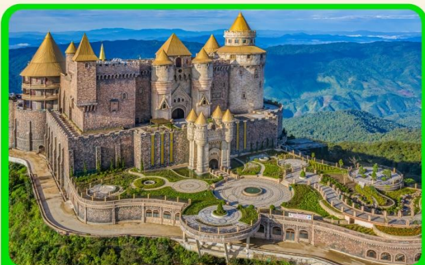
เที่ยวบานาฮิลล์แบบจุใจ เต็มวัน