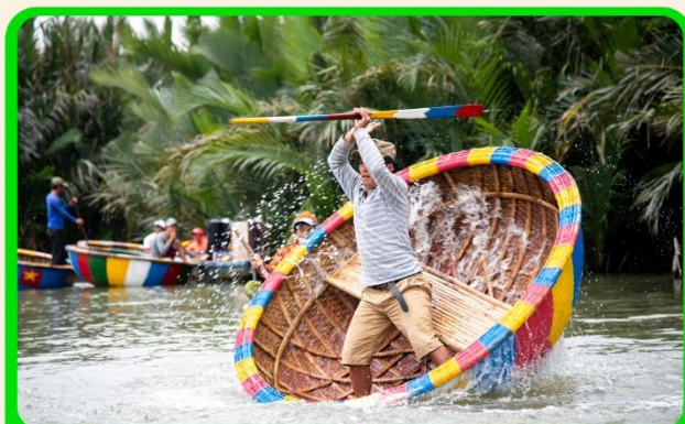
พิเศษ !!! นั่งเรือกระดัง UNSEEN เวียดนาม