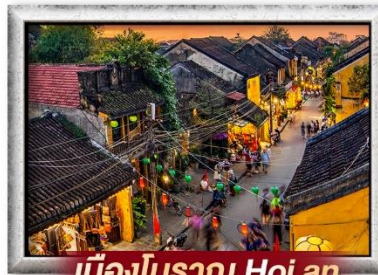
เมืองโบราณ Hoi an