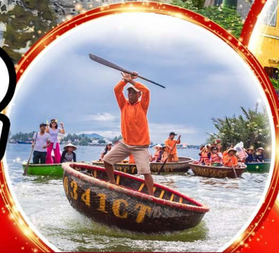
นั่งเรือกระดัง Hoi an