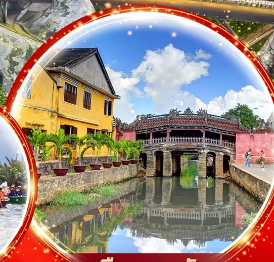
เมืองฮอยอัน