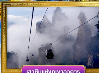
เสาคินแห่งภูเขาอวตาร