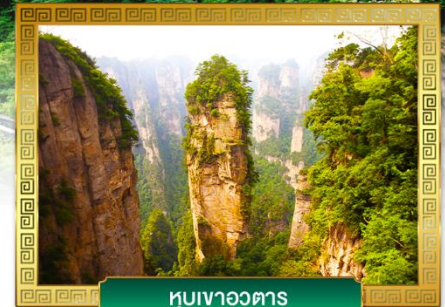
หุบเขาอวดตาร