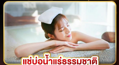
แช่น้ำแร่ธรรมชาติ