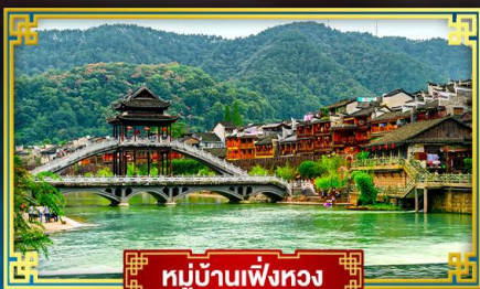
หมู่บ้านเฟิ่งหวง

ชุมชนระดับโลกกลางผาหนมอก "ฟ่านจิ่งซาน" ท่องสู่อินแดนแห่งภาพวาดจากเจียเจีย