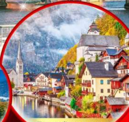
พิเศษ!! พัก Hallstatt หรือ St. Wolfgang ริมน้ำทะเลสาบ 1 คืน