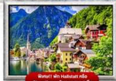
ฟินู! ฟิน Hallstatt หรือ St. Wolfgang รับประทานอาหาร 1 ครั้ง

พิเศษ!! ลิ้มลองเมนูประจำชาติ ทั้ง 5 ประเทศ!!!