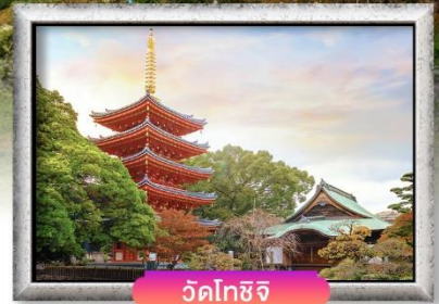
วัดโทโชจิ