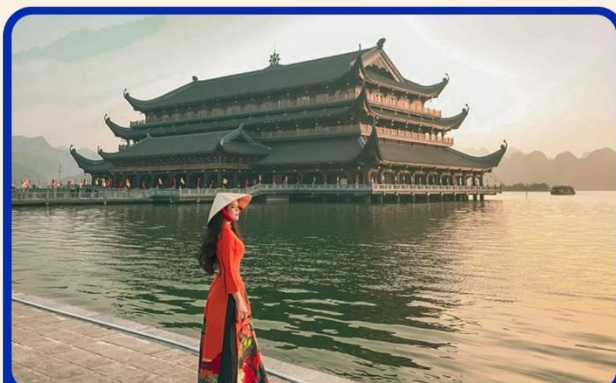
จุดเชคอินแห่งใหม่ "วัดตามจุก"