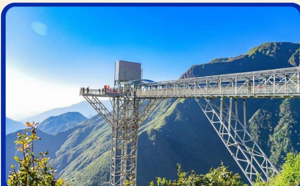
สะพานแก้วมังกรเมฆ (Rong May Glass Bridge)