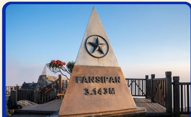
น้ิงกระเช้าสู่ยอดเขาฟานซิปัน