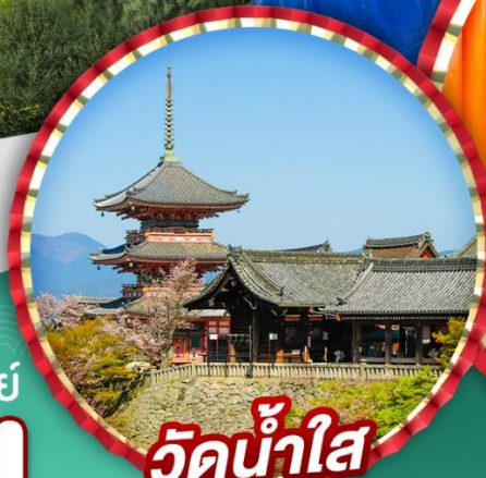
วัดน้ำใส