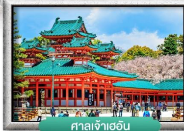
ศาลเจ้าเออิน