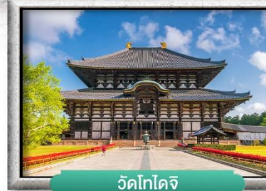
วัดโทไดจิ