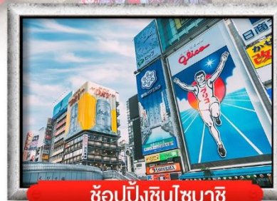
ช้อปปิ้งชินโซบาชิ

เมนู สุดพิเศษ !! บุฟเฟ่ต์ชาบู , หมูย่างไบโอบะ