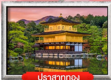
ปราสาททอง