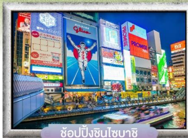
ช้อปปิ้งชินโซบาชิ