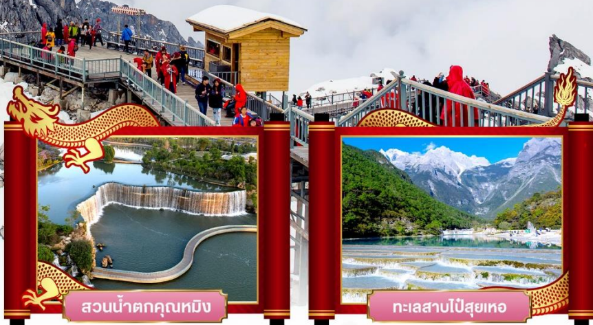
สวนน้ำตกคุณหมิง

✓ พิเศษ! โชว์จางอวิโหม่ว "ความประทับใจลี่เจียง"