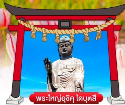
พระใหญ่อุซึคุ ไดบุตสึ