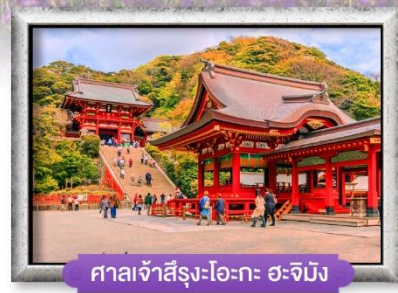
ศาลเจ้าสีรุ้ง-โอะกะ-อะจิเม็ง

พิเศษ! บุฟเฟ่ต์ซาปู, แช่น้ำแร่ออนเซ็น 5 วัน 3 คืน ✂️ อาหาร : 6 มื้อ เดินทาง ก.ค. - ส.ค. 66