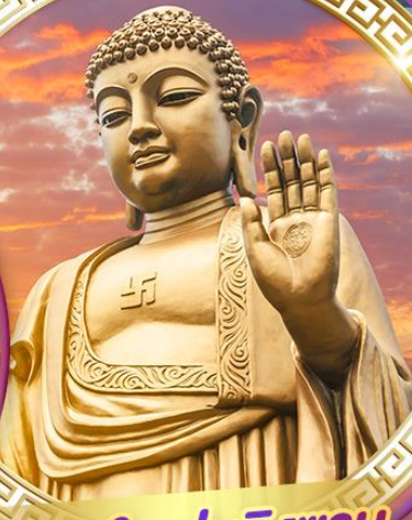
พระใหญ่หลิงชาน

📅 เดินทาง : 10-14 / 11-15 / 12-16 เม.ย.67