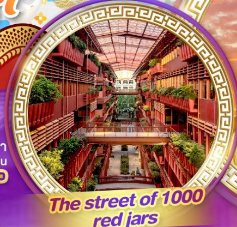
The street of 1000 red jars

สักการะพระใหญ่หลิงชานต้าฟอ ถ่ายรูปคู่กันดัมยักซ์ ชมสุดยอดพุทธศิลป์ร่วมสมัยของจีน "ศาลาฟานกง"