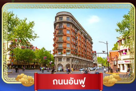
ถนนอันฟู