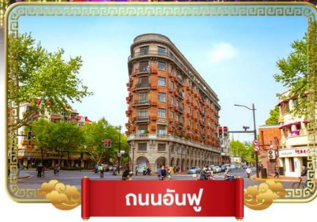
ถนนอันฟู่