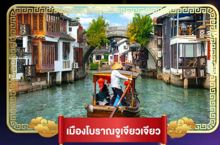
เมืองโบราณจูเจียวเจียว