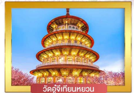
วัดอู่จีเทียนหยวน