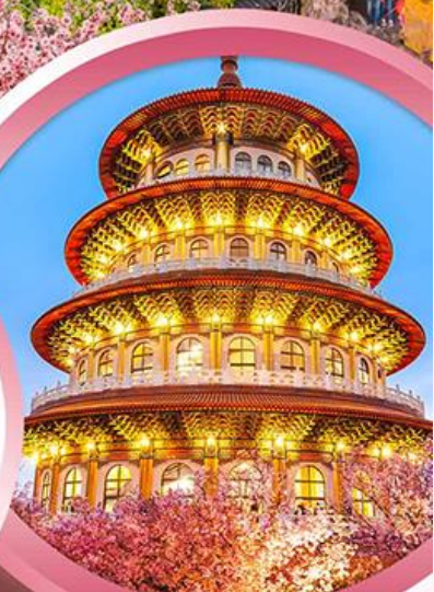
วัดจู้เทียนหยวน

ช้อปปิ้งจุใจ ย่านซีเหมินติง ตลาดไทจงไนท์มาร์เก็ต อิมอร่อยกับ..เมนูปลาประรานาธิบติ ชาบูบุฟเฟ่ต์สไตล์ไต้หวัน เสียวหลงเปา