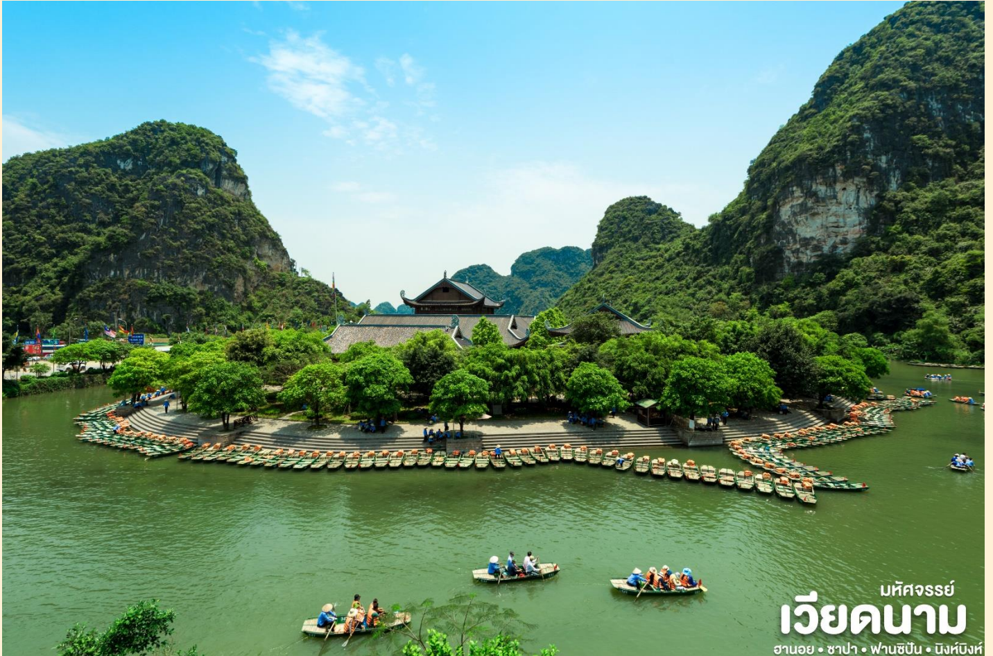
มหัสจรรย์ เวียดนาม ฮานอย • ซาปา • ฟานซิปัน • นิงห์บิ่งห์