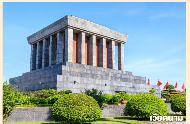
มหัสจรรย์ เวียดนาม ฮานอย • ซาปา • ฟานซิปัน • นิงห์บิ่งห์

ชม จัตุรัสบาดิญ เป็นจัตุรัสที่มีชื่อเสียงของกรุงฮานอย ซึ่งมีความสำคัญทางประวัติศาสตร์คือประธานาธิบดีคนแรกของเวียดนามได้มาอ่านคำประกาศอิสรภาพ ณ ที่แห่งนี้ เมื่อวันที่ 2 กันยายน 1945 หลังสงครามโลกครั้งที่สอง และเป็นที่ตั้งของทำเนียบและกระทรวงต่างๆ รวมถึงอนุสรณ์สถานโฮจิมินห์อีกด้วย นำท่านชม โบสถ์ฮานอย เป็นสถานที่สำคัญอีกแห่งหนึ่งของเวียดนาม