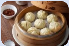
เที่ยง บริการอาหารกลางวัน ณ ภัตตาคาร เมนูพิเศษ!! เสี่ยวหลงเปา (5)

นำท่านนมัสการ วัดหลงซาน (Longshan Temple) เป็นวัดที่เก่าแก่และมีชื่อเสียงของคนไต้หวัน วัดแห่งนี้มีอายุราวๆ เกือบ 300 ปี ด้านหน้าตกแต่งด้วยเสามังกรทั้งชายและขวา เปรียบเสมือนกำลังปกป้องห้องโถงกลาง ในปี ค.ศ. 1740 เกิดความเสียหายครั้งใหญ่ทางวัดจึงได้รับการบูรณะหลายครั้ง ทั้งบานประตู คาน หลังคา และเสามังกรแกะสลักตระหง่านสวยงาม เป็นประติมากรรมที่มีความละเอียดอ่อนเป็นงานไม้ที่สวยงาม มีหนังสือจินโบราณประดับตรงทางเข้าให้ความสัมผัสของวรรณกรรมนอกเหนือจากคุณค่าทางศานายังส่งเสริมการท่องเที่ยวอีกด้วย ปัจจุบันเป็นที่นิยมมาขอพรเรื่องการทำงาน การเรียน ที่สำคัญเรื่องความรัก เชื่อกันว่าใครที่ไม่ประสบความสำเร็จเรื่องความรัก ให้ขอพรกับเทพเจ้าจันทราที่วัดแห่งนี้ แล้วความรักจะกลับมาดีขึ้น